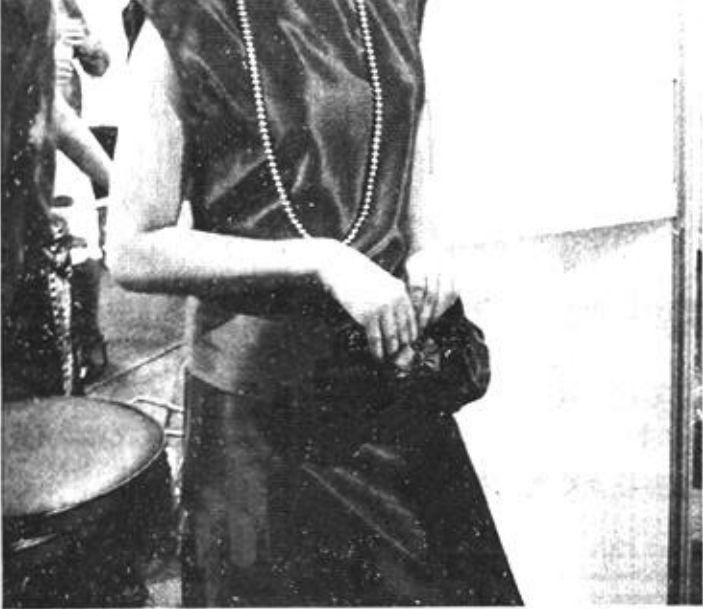
9月15日，乌克兰首届时尚风格大赛在基辅举行。闯入决赛的20名选手把观众们带入了一个全新的时尚世界。大赛中，服装、首饰、头饰、化妆等各方面的风格和整体搭配以及选手的举止形态都是评定成绩的依据。图为选手在表演中。

很多事情用在动物身上可以，用在人身上却不行，由于基因工程的发展，对药物的审查也要加强，首先要审查伦理道德问题，然后是药效，否则一律不允许生产。巴德年说，据他介绍，目前整个人类基因组计划已经拿出5%的经费研究伦理与法律问题。