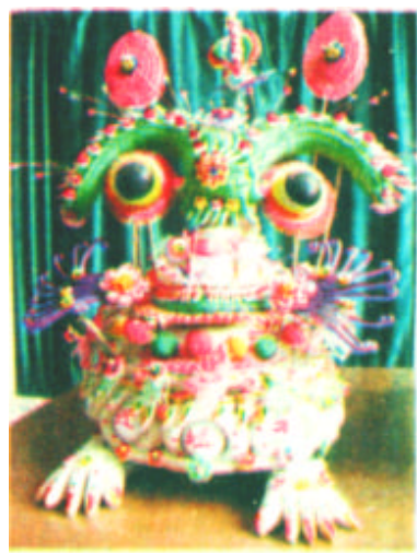
面花，在陕西省合阳县被称为“花馍”，是广泛流传于民间的一种风俗艺术，也是中国北方民俗文化的重要组成部分。一种风俗艺术制作精巧，造型美观，是艺术性极高的民间艺术品。合阳县的面花久负盛名，被列为“秦艺六绝”之一。这是用于贺婚的狮子头馍。

新闻热线 8330149 8331392 电子信箱 dyrb@sina.com 2001年9月19日 星期三 第167期 总第2516期 全国统一刊号 CN37-0054 邮发代号 23-172