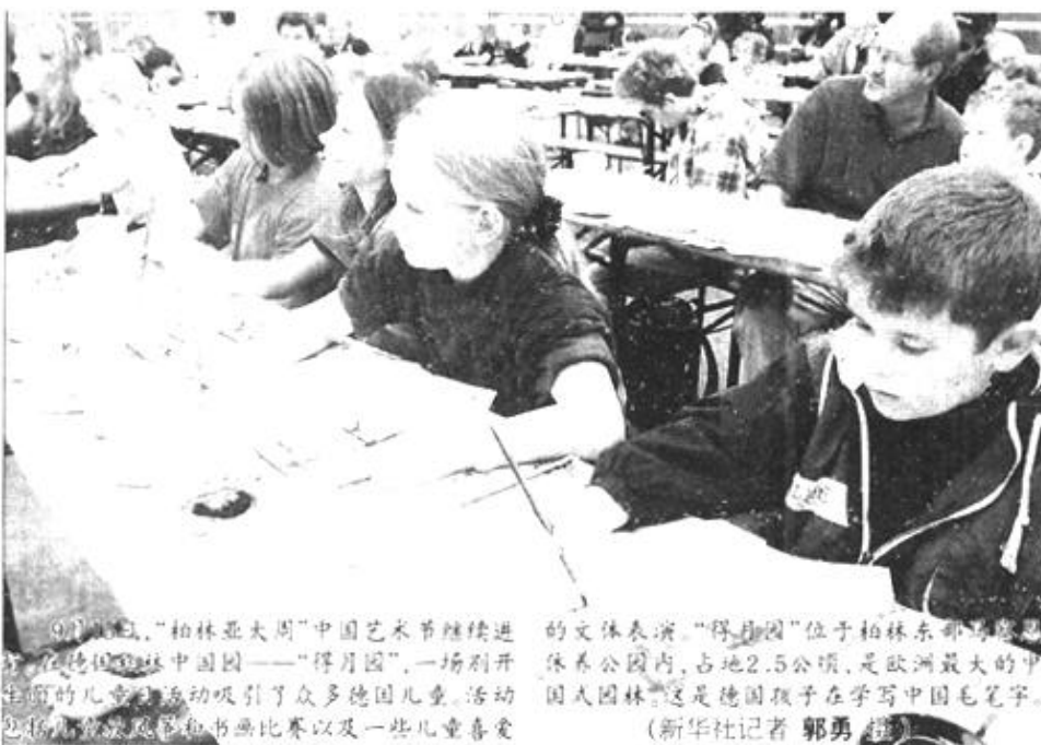
“柏林亚太”中国艺术节期间，在柏林东亚公园里，占地2.5公顷、是欧洲最大的中国儿童书画活动吸引了众多德国儿童。活动吸引了德国孩子在学写中国毛笔字。