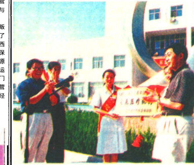
有关部门正在为市人民医院挂牌。

到定点医疗机构就医 可享受定点医疗机构待遇 我市首批确定六十家 9月13日下午，市劳动保障局为市人民医院、市中医院等第一批定点医疗机构举行揭牌仪式，第一批被确定为定点医疗机构的共有60家。定点医疗机构的设立，标志着我市的医疗保险制度改革迈入了规范化轨道。我市的城镇职工基本医疗保险制度改革自今年7月1日正式启动以来，到目前已经运行了两个多月。从实施的情况看，新旧办法过渡平稳，取得了良好的社会效益，职工普遍反映良好。目前，已办理社会保险登记的机关事业单位近200多家，覆盖率达到90%以上。尤其是中央、省属单位参加医疗保险的积极性和主动性都比较高，全市参保职工39万人，目前，已按新办法执行的已超过30万人，参