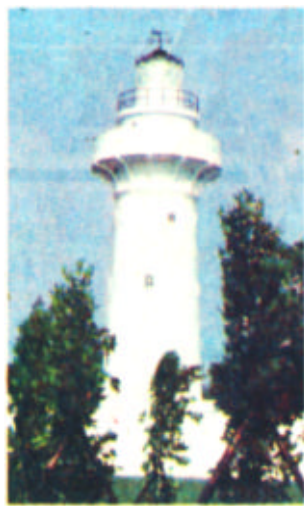
素有“东亚之光”美誉的鹅銮鼻灯塔坐落在台湾的最南部，始建于清代光绪八年（一八八二年），该塔高十八米，塔顶射出的二百八十万烛光的光束可指引一百二十里外的船只，是台湾岛最具代表性的景观。